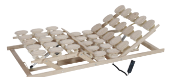
Motorrahmen mit Netzfreeschaltung (nicht mit Komfort-Schulterzone erhältlich)