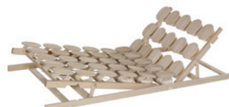
Sitz- und Fußhochstellung